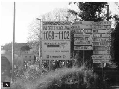
Entrée du parc d'activité. / Entrance to activity park.