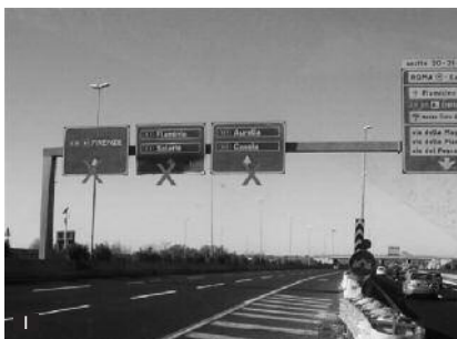
En provenance du Sud autoroute A 1 (Naples) suivre Aéroport Fiumicino. / When coming from the South highway A 1 (Naples) follow Fiumicino airport.

Tél. hors d'Italie / Tel. outside Italy: +39 069 926 83 92