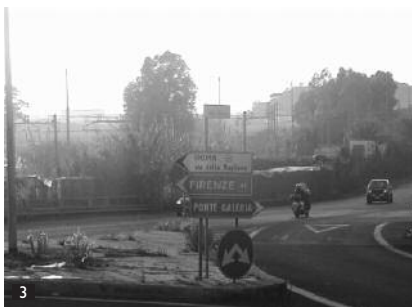
Suivre PONTE GALERIA. / Follow PONTE GALERIA.