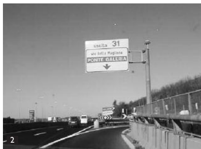
Sortie 31 PONTE GALERIA. / Exit 31 PONTE GALERIA.