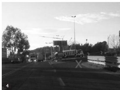
Poursuivre en direction de PONTE GALERIA. / Continue in the direction of PONTE GALERIA.