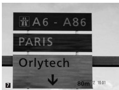
Ensuite suivre Direction Paris A 6 / A 86, Then follow signs to Paris A 6 / A 86.

Tél. hors de France / Tel. outside France: +33 1 49 75 14 55