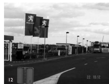
Le centre Peugeot Open Europe est à 50 m en face sur le côté gauche. The Peugeot Open Europe centre is 50 m ahead on the left-hand side.