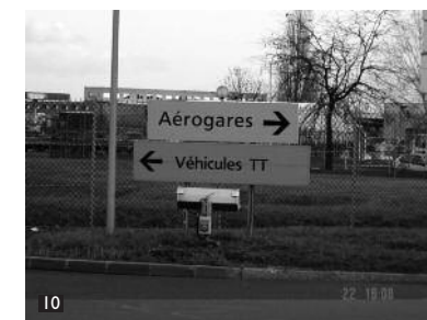
Au stop, traverser le carrefour direction Véhicules TT. – attention carrefour dangereux – At the stop sign, cross the crossroads in the direction of Véhicules TT. – be careful, it is a dangerous crossroads –