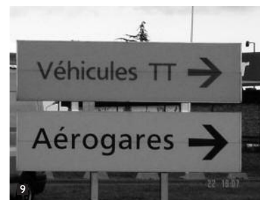
Suivre la direction Aérobares et Véhicules TT. Follow signs to Aérobares and Vehicles TT.