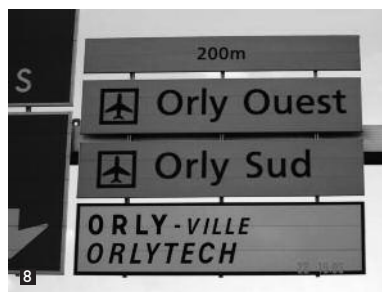
Prendre la 1 ère sortie ORLYTECH / ORLY OUEST / ORLY SUD. Take the 1 st exit ORLYTECH / ORLY OUEST / ORLY SUD.